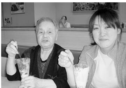
あまくておいしいね♥

帰ってこられた時には満面の笑みで「おいしかった、また行きたい！」と大好評でした。皆さんの笑顔を楽しみに、ぜひ今後も続けていきたいと思えます。