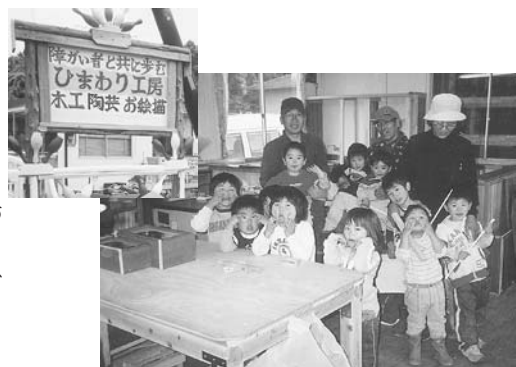
かなづち トントン 楽しいな