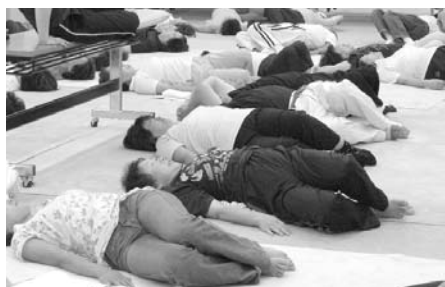
歩っ歩(ぼっぼ)体操でみんな元気！