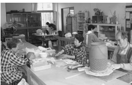
仕上がりを楽しみ！