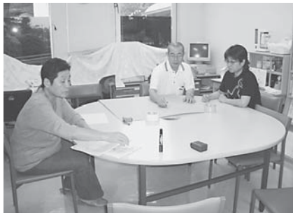
掲示物の準備をするサポーターの皆さん

このような事業運営の支援をしているのがサポーターの皆さんで、毎月第1水曜日は午後1時30分から各種事業の準備を兼ねた打合せを開いています。また、体験学習においては、インスタントシニア(高齢者疑似体験)などの指導者として活躍しています。現在25名の方が活動していますが、今後さらに充実した事業運営をしていくためには、より多くの人の協力が求められています。ぜひ皆さんの積極的な参加をお待ちしています。