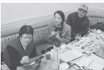
次は何を歌おうかしら