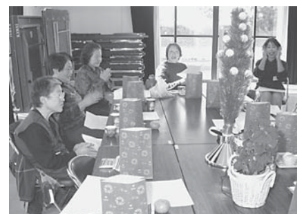
みんながあつまると楽しいね

若い頃や故郷の話などで、時間の経つのも忘れ、とても盛り上がり笑顔がいっぱいでした。足が不自由で、あまり外に出ることがないという人も、「いきいき波野さろん」がとても楽しくて、次の集まりが待ち遠しいようでした。