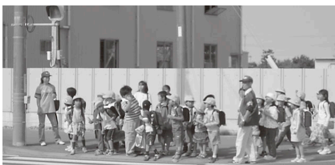
平井地区 ひらあい会