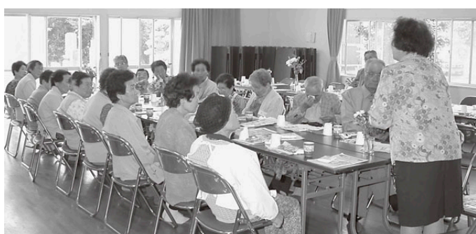
波野地区 いきいき波野