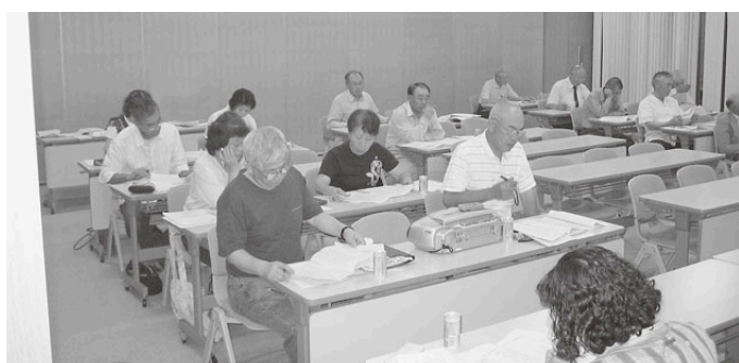
中野東地区 なかひがし