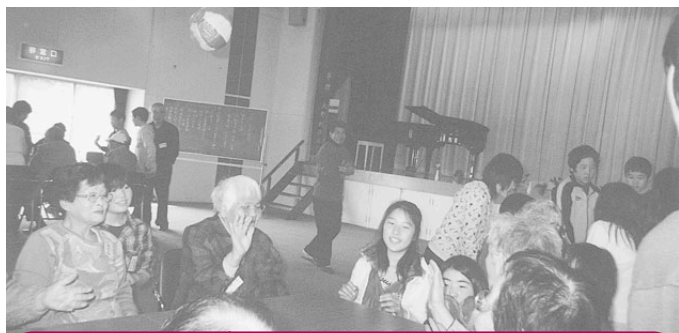
大同東地区 大東あゆみの会