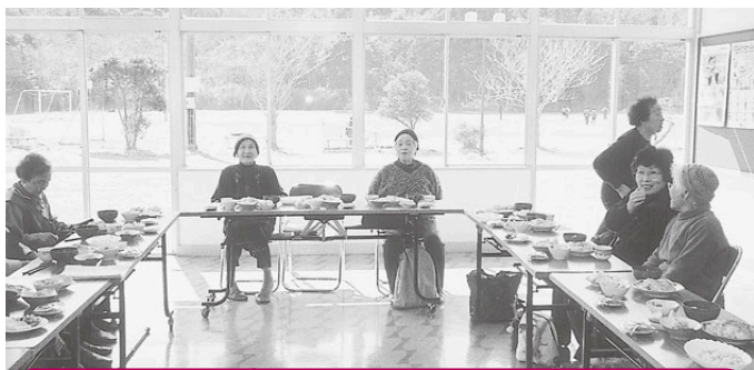
豊郷地区 あい豊郷