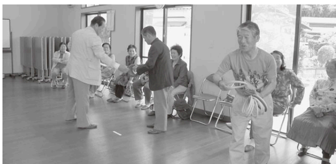
高松地区 たかなみ会