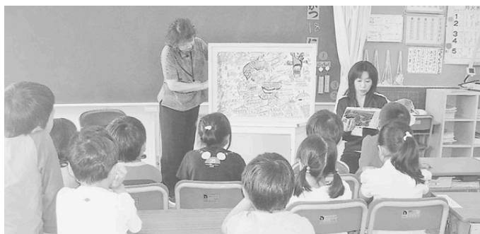
鉢形地区 はちふく会

地区社会福祉協議会 （略して「 地区社協 」）は、小地域で住みよい福祉のまちづくりを推進することを目的に、地域住民の参加と協力により、自分たちの身の回りに起きている生活上の問題について協議し、個人・団体・各種組織が相互に協力体制を図りながら、問題解決のために活動を推進していく住民の自発的な組織です。