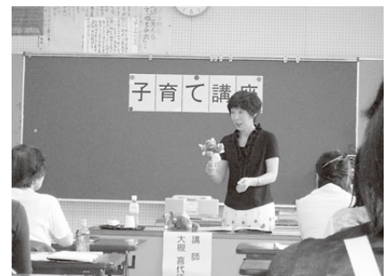
身近なものでおもちゃ作り

子どもを預かった時の接し方や、絵本や手作りおもちゃの紹介があり、21名の参加者は熱心に聞いていました。その後「つどいの広場おもちゃの城」にて保育士と一緒に歌いながら、子どもの体をマッサージする「ふれあい遊び」やパネルシアターを楽しみました。幼児を連れて参加した人たちが親子で楽しめたようです。