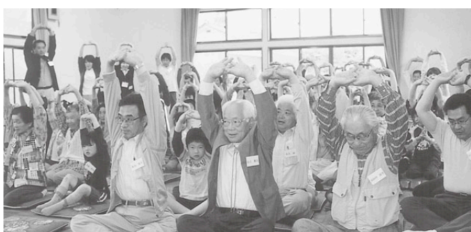
中野西地区 ウエル西