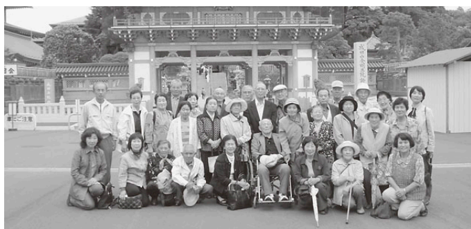
豊津地区 うらら会