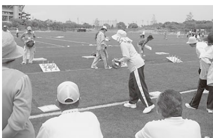
難しいルールもなんのその!