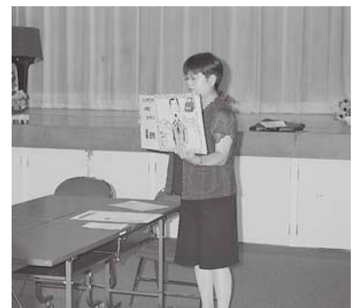
とてもわかりやすかったです。

9月11日(木) 大野まちづくりセンターで、大同東地区のひとり暮らし高齢者食事会(大同東お元気会)がありました。最近、悪徳商法のトラブルに巻き込まれる高齢者が増えているため、食事の後、消費生活センターの職員による悪徳商法講座が開かれました。紙芝居を使って、訪問してきた販売員を上手に断る方法や、クーリング・オフの仕方、催眠商法にだまされないための方法などをわかりやすく教えてもらいました。参加した対象者とボランティア総勢80名の皆さんは真剣に聞いていました。