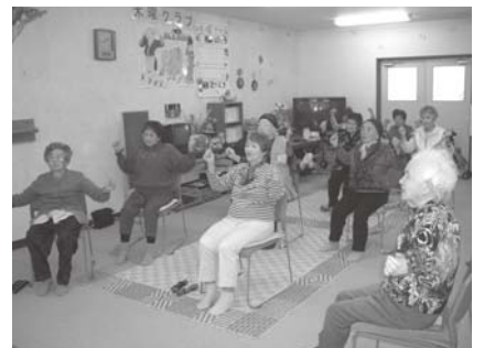
ゆっくりマイペース

行ったり、カラオケやお誕生会など、楽しい企画で、集まっている皆さんは、とてもにぎやかに一日を過ごしています。「歌ったり、おしゃべりしたりする事が、とても楽しみ。」と話してくれました。市老人福祉センター以外でも、はまなすまちづくりセンター、豊津まちづくりセンターで行われています。