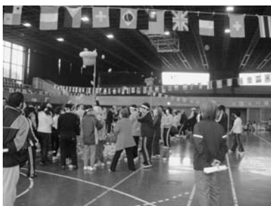
【たくさん入ったかな?】