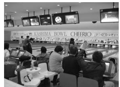
【スベアとれました!】

11月7日(土)、ショッピングセンターチェリオ内の鹿島ボウルで、アシストふれあいボウリング大会が開催されました。障がいのある人とボランティアのふれあいを目的に実施されているこの大会は、鹿島ボウルから全員のプレー代・貸し靴代が無料で提供されています。今回は高校生ボランティアを含めた24名が参加し、各レーンに分かれ楽しくも白熱したプレーが繰り広げられました。あちらこちらから歓声があがり、みんなが一緒になって楽しみました。