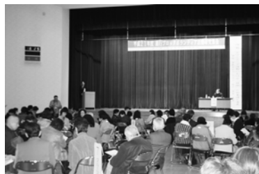
【たくさんの意見ができました】

1月23日(土)銚田市大洋公民館大ホールで、平成21年度鹿行ブロックボランティア活動集会が開催されました。各ボランティア団体間の連携と、地域における幅広いニーズに対応した地域福祉の推進、スキルアップを目的として、