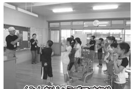
(みんなしょうずですわね!)

7月13日(火)豊津小学校の4年生11名が、大野手話クラブの人に手話を教えてもらいました。この教室は、高齢者疑似体験・車いす・点字など、毎年行われる福祉体験授業の一つです。いろいろな手話を教わり、手話で会話をしたり、挨拶ができるようになりました。また、「さんぽ」の曲に合わせて手話で歌を歌ったり、手話の言葉当てゲームもしました。最後に、一人ひとりが自分の名前を手話で発表しました。こうした経験は子どもたちの視野を広げ、豊かな心を育てていくことになり、子どもたちにとって素晴らしい授業となりました。