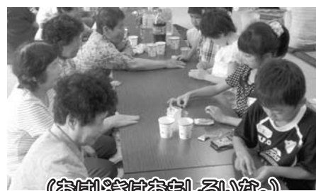
(おはじきはおもしろいな。)