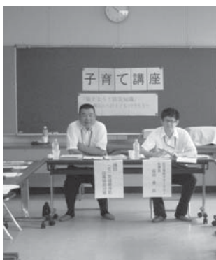
〈ためになる講座でした〉