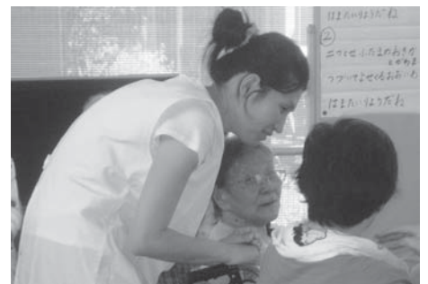
〈優しく話しかけます〉

ウェルポート鹿嶋の郷では、入所者やデイサービスの利用者の皆さんと一緒に歌ったり、体操・ボール遊びなどに参加し、積極的にコミュニケーションを取りながら、熱心に取り組んでいる姿が印象的でした。