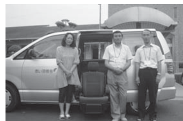
〈私たちが送迎を行います〉