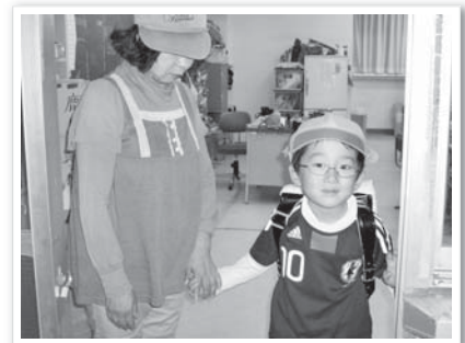
〈児童クラブへのお迎え風景〉

市ファミリー・サポート・センター 〒314-0012 鹿嶋市平井1350-45 市社会福祉協議会事務局内 TEL/FAX 83-4811(直通)