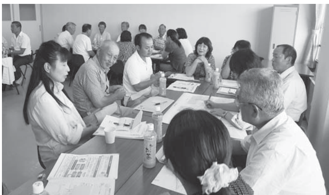
ワークショップでは、自分の住む地域について熱く語り合いました

地域福祉の主役は、すべての市民で 宥心して生活できる地域づくりが必要 鹿嶋市社会福祉協議会では、誰でも 参りますので、皆さまのご協力をよろ