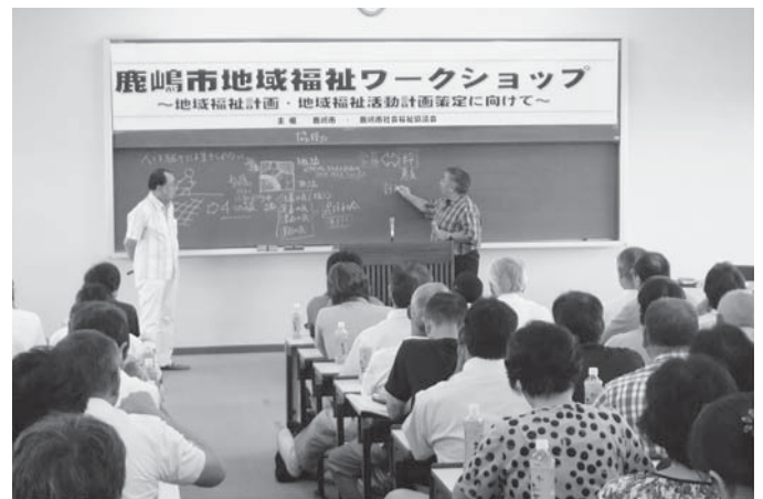
地域福祉について、講演会を開催しました