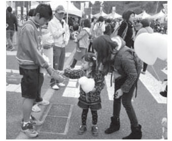
～みんなのひろば会場にて～

10月1日から全国一斉に始まりました「赤い羽根共同募金運動」は、12月末日を持ちまして終了いたしました。お寄せいただきました募金は福祉の充実に向けて大切に活用させていただきます。募金にご協力いただきました自治会役員をはじめとする市民や企業の皆さん、そして街頭募金活動をされた皆さんの多大なお力添えに厚くお礼申し上げます。