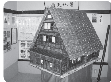
（世界遺産 萩町 白川郷）

現物の1/12に再現されたミニチュアは精巧そのもの。鹿島神宮門前通り「ミニ博物館ここしか」に展示してあります。