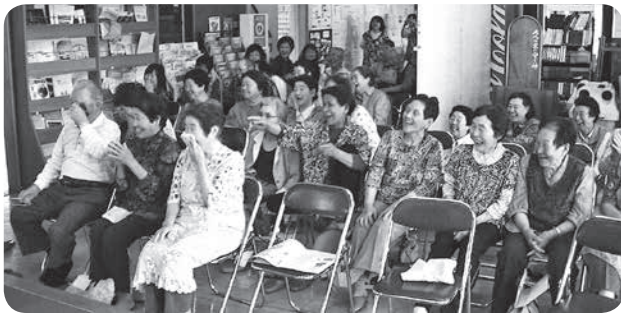
「お食事会」大笑いの演芸観賞

私の一番好きな新緑の季節。この時期にしか見られない鮮やかな緑色は、私に元気をくれ、穏やかな気持ちにさせてくれる。大きな自然災害や、国と国とのいさかいに、私個人は無力だが、せめて出会った人々に、新緑のような穏やかで爽やかな気持ちになってもらえるような人になりたいと思う。