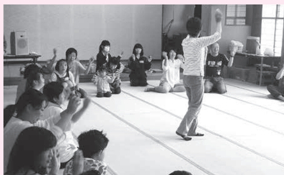
アシストタイム(障がい者交流事業)