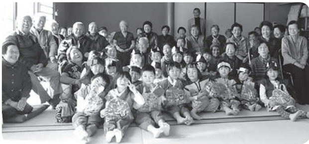
「クリスマス会」子どもたちがお遊戯披露！