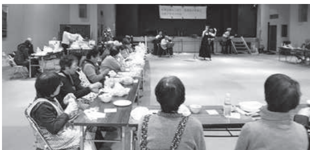
〈筑西地方家族会つばさとの交流会〉クリスマスパーティー