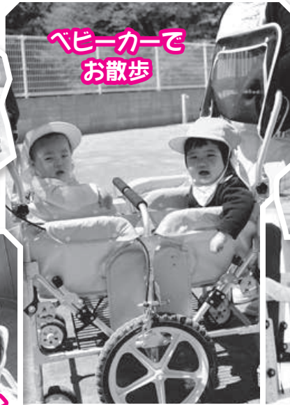
ベビーカーで お散歩