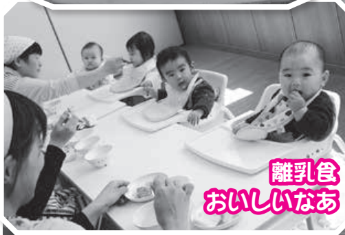
離乳食 おいしいなあ