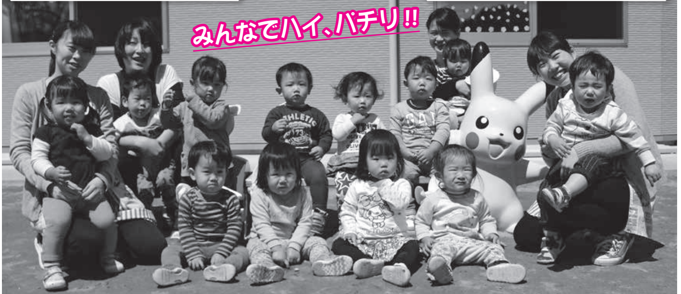
みんなでハイ、パチリ!!