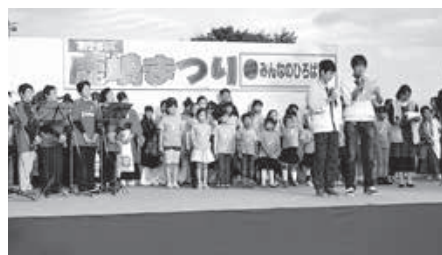
28日(日) ◆未来に届け! フィナーレ