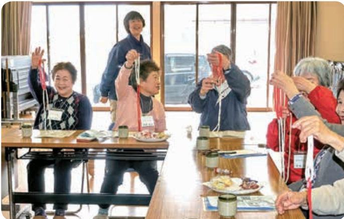
▲ サロン活動 楽しいマジック体験