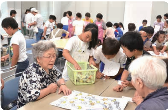
▲ ふれあい食事会(お元気会) 大同東小学校 交流