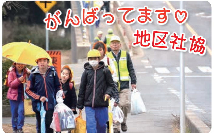
▲ 見守り隊 大同東小学校集団下校時