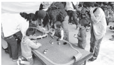
◆出張つどいの広場「おもちゃの城」