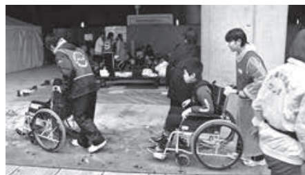
◆ふくし体験 (車いす)