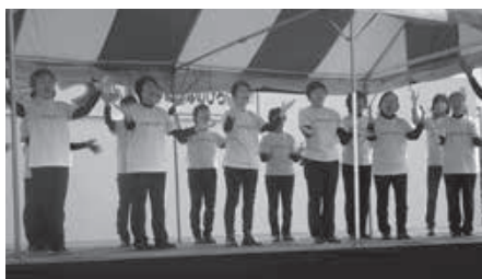
27日(土) ◆な~んでもウェル