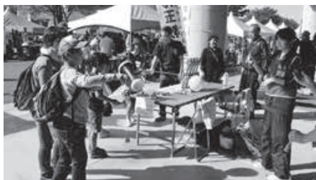
◆ゆうあいランド (一部有料)