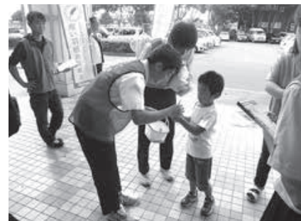
▲イオン鹿嶋店・チェリオ街頭募金の様子