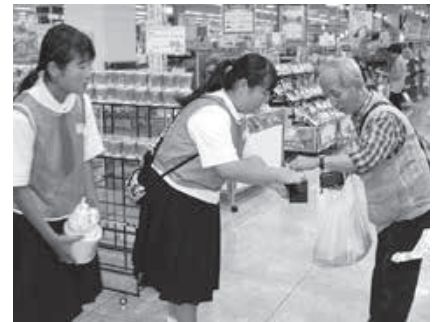
▲イオン鹿嶋店・チェリオ街頭募金のようす