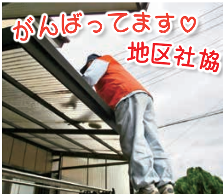
がんばってます♡ 地区社協