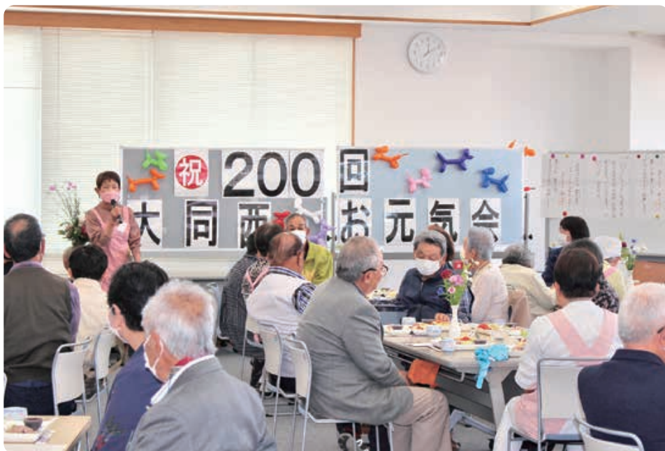
▲お元気会代表あいさつ

編集・発行 社会福祉法人鹿嶋市社会福祉協議会 鹿嶋市平井1350-45(総合福祉センター内) TEL 0299-82-2621 FAX 0299-83-0242 URL http://kashima-shakyo.jp E-mail k-shakyo@sopia.or.jp