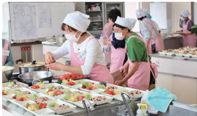
▲手づくりのお食事