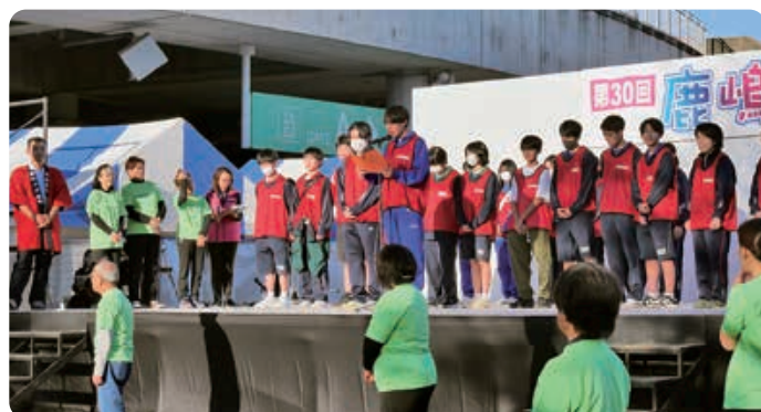
▲ファイナーレ(高校生によるエンディングメッセージ)