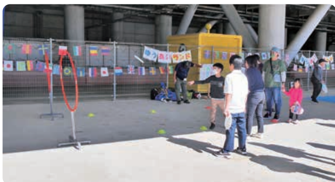
▲ニュースポーツ(フライングディスク)