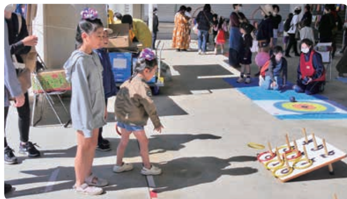
▲ゆうあいらんど(輪投げ)