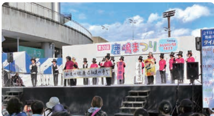
▲ボランティアグループ活動紹介

編集・発行 社会福祉法人鹿嶋市社会福祉協議会 鹿嶋市平井1350-45(総合福祉センター内) TEL 0299-82-2621 FAX 0299-83-0242 URL http://kashima-shakyo.jp E-mail k-shakyo@sopia.or.jp