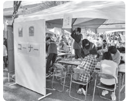
▲ふくし体験の様子(2023)