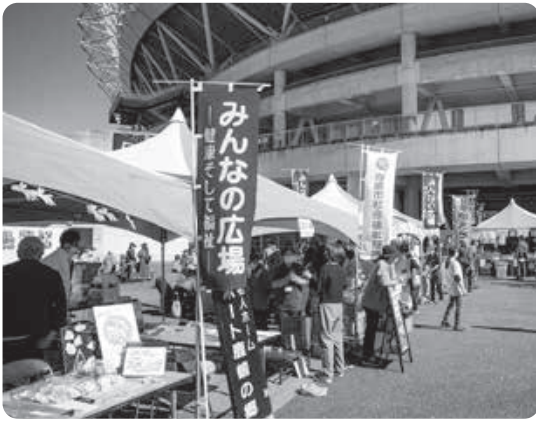
▲福祉施設の活動紹介の様子(2023)