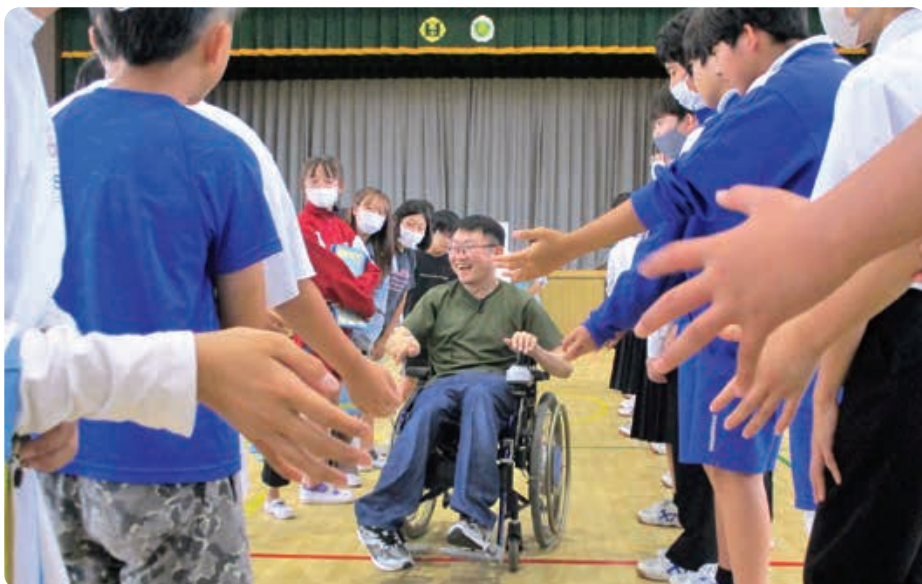
▲福祉講話(講師とのふれあい)