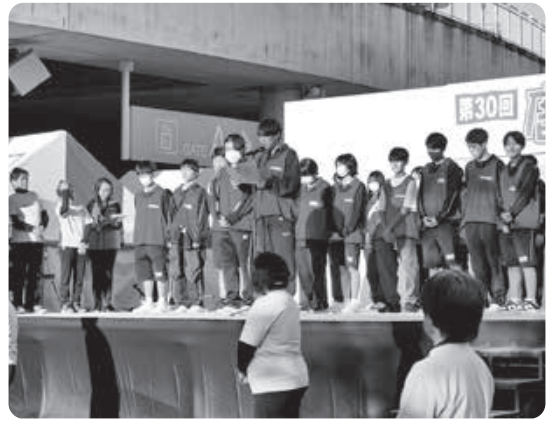
▲フィナーレの様子(2023)