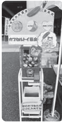
▲ガチャde募金 (カプセルトイ募金)