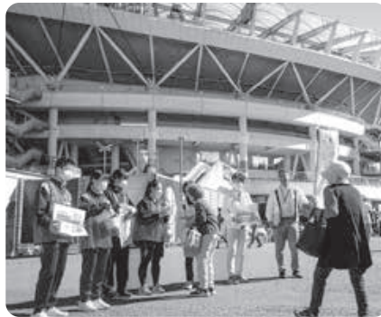
▲共同募金活動の様子(2023)