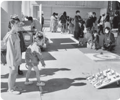
▲ゆうあいらんどの様子(2023)

「みんなのひろば」は、すべての人が社会の中でふれあい、助けあいながら生活していける社会づくりを目指します。そして、多くの皆さんがこのまつりに参加することで、福祉に対する意識を高め、「共生の社会」の担い手として、一緒に歩むきっかけとなることを目的に開催します。